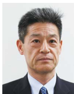
全国共済農業協同組合連合会岡山県本部