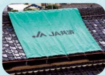
災害シートの無償配布