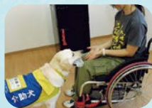
介助犬の育成・普及支援