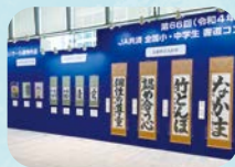
書道・交通安全 ポスターコンクール