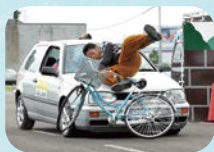
中・高校生向け 自転車交通安全教室